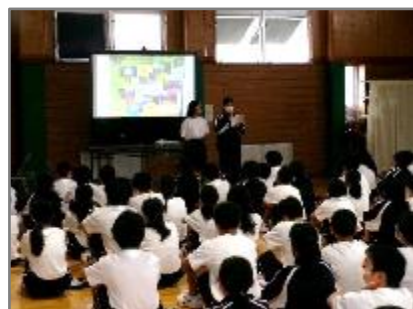
地域防災・環境マップ発表