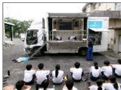
起震車での地震体験