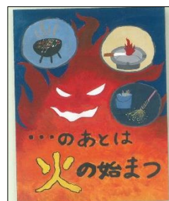
【防火ポスター最優秀賞作品】