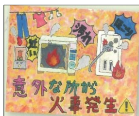
【防火ポスター優秀賞作品】

防火ポスターの部 1,389 作品、防火習字の部 4,133 作品の応募の中から、下野地区では次の方が入選されました。おめでとうございます。